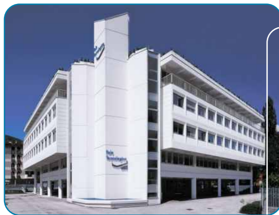
BIC di Trento